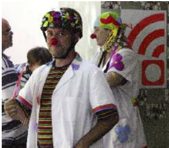
Fira de Circ. La Fira de Circ va ser un dels esdeveniments de l'estiu. Entre les companyies que van ser a la Bisbal hi ha els pallasos que animen els nens i nenes que han de fer estada a l'hospital Josep Trueta, que van ser al vestíbul del Mundial.