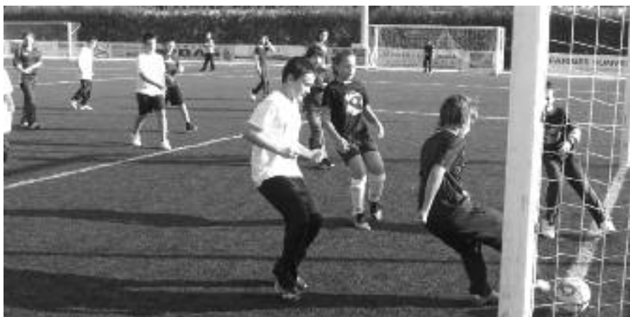
Una de les activitats esportives organitzades pel Patronat.

I per últim, millorar la capacitat de reacció enfront de les noves tendències i modes que