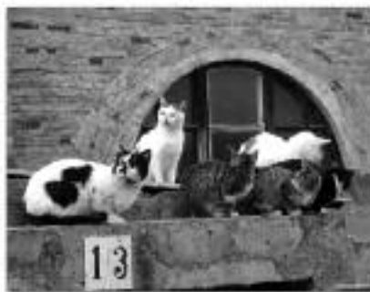
L'extensió incontrolada de colònies de gats crea problemes higiènics i sanitaris.

Per tant, sense la possibilitat del sacrifici i