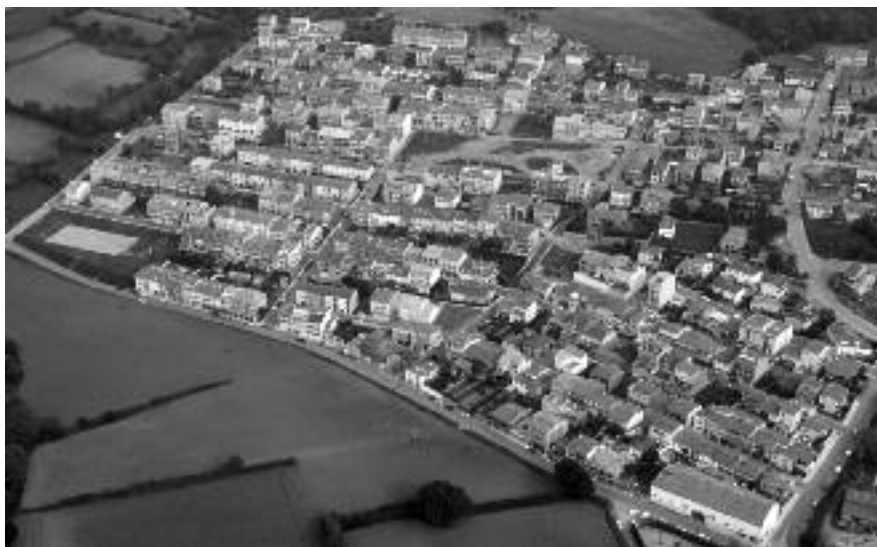
Vista aèria de la urbanització del puig de Sant Ramon on és previst actuar en els carrers on no s'ha actuat mai des de la seva urbanització.

També s'instal·laran tres hidrants a la zona d'Ateneu Pi i Margall i a la zona de