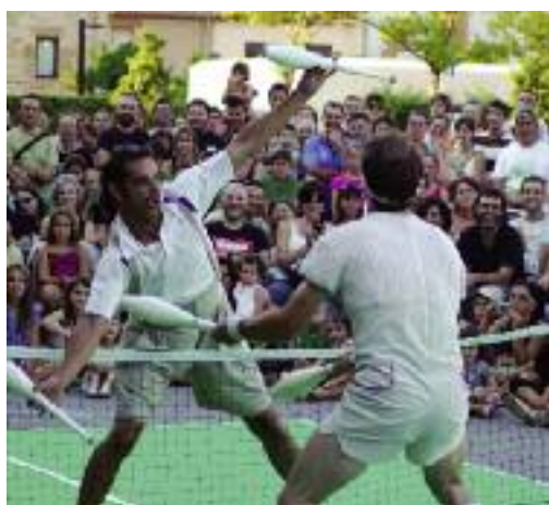
Fira de Circ. La quinzena edició es va fer els dies 16, 17 i 18 de juliol, va presentar uns 125 espectacles entre els de la pròpia fira i els de l'activitat paral·lela de Firabar. Se'n pot veure una mostra més àmplia al web de la fira www.firadecirc.org .