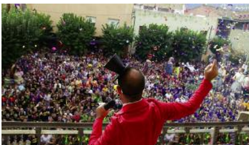
Festa major. La festa major de la Bisbal va iniciar-se aquest any amb la presentació del nou disc de l'artista local Sanjosex, en un concert que va rebre molt bones crítiques. A la imatge, el cercavila, amb un seguiment multitudinari, a la plaça de l'Ajuntament.