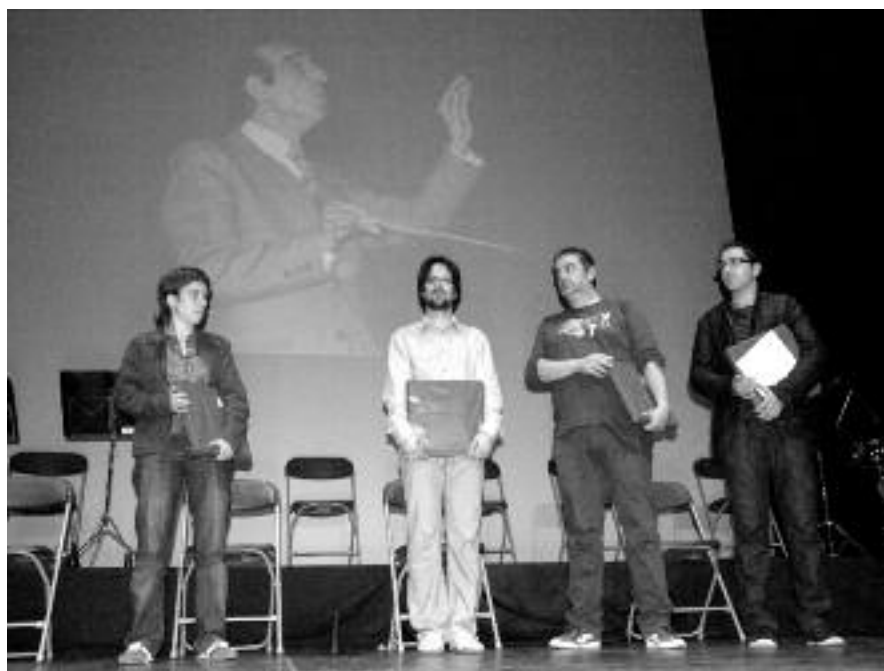
Els guardonats i els finalistes que van ser presents a l'acte.

En la primera part, La Principal de la Bisbal i La Bisbal Jove van interpretar les cinc sardanes finalistes. A la segona part, La Bisbal Jove va interpretar 'Un somni