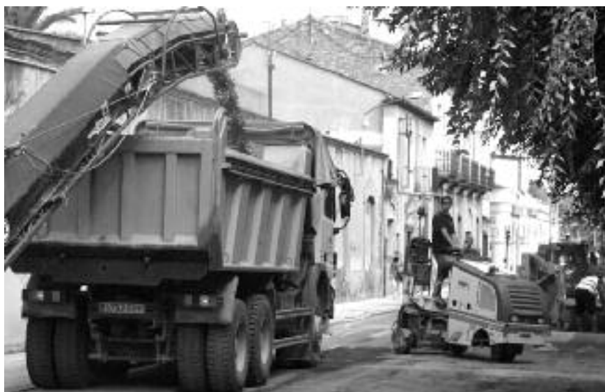
Imatge dels treballs al carrer Coll i Veí, aquest setembre.

Segons el regidor de Via Pública de l'Ajuntament, Xavier Dilmé, "s'ha tractat d'una actuació important, que enllestirem d'aquí a pocs mesos amb un segon grup de carrers". Segons el regidor, s'han prioritzat els carrers amb el ferm en més mal estat però també aquells que eren més transitats: "aquest equip de govern ha prioritzat sempre el dia a dia, compatibilitzar les grans obres amb mantenir nets i en condicions els espais públics i aquesta actuació s'inclou en