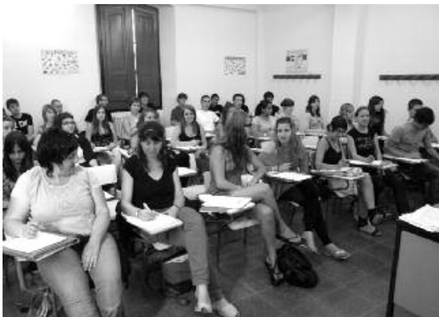
El curs de preparació a les proves d'accés a grau superior ha superat totes les expectatives i a part del grup del matí -a la imatge- se n'ha fet un de tarda.

'Creiem que això és un èxit rotund de l'Aula d'Adults de la Bisbal i cal reconèixer la molta i bona feina que ha fet la tècnica de l'àrea', ha assegurat la regidora, que ha afegit que vist l'èxit d'aquestes proves ara es planteja implantar de cara a l'any vinent les proves d'accés a la universitat per a majors de 25 d'anys. Núria Felip diu que amb això s'haurà implantat l'accés a totes les etapes formatives. 'Penso que per sobre de tot s'han