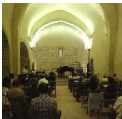
Festa Major de Sant Pol. La festa major de Sant Pol va acollir un concert de piano a quatre mans el divendres 23 de juliol i havaneres i cremat el cap de setmana.