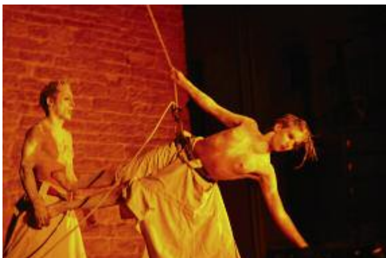
Fira de Circ. Una de les actuacions més espectaculars la van fer una parella que va literalment ballar sobre la façana del Castell Palau de la Bisbal. La companyia B612 va actuar la mitjanit del divendres oferint gairebé mitja hora de dansa vertical.