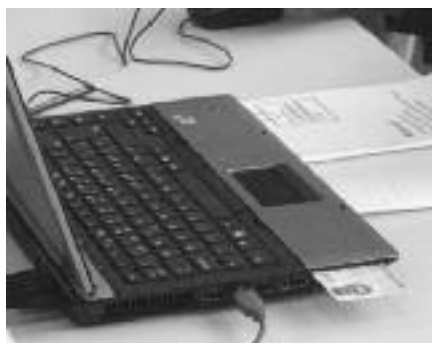
Vot amb DNI electrònic al col·legi electoral del camp dels Capellans, on es va fer l'experiència pilot de vot administrat electrònicament.

Tanmateix, l'ús d'aquest sistema ha permès simplificar i agilitar els treballs de la mesa, ja que la informació comuna de les actes només s'ha de transcriure una vegada i les trameses de dades al Centre de Recollida d'Informació es van fer de manera automàtica i immediata.