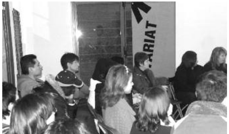
L'inici de la nova edició del 'Voluntariat per la llengua'.

El passat 21 de novembre es va donar inici a la nova edició del "Voluntariat per la llengua" a la Bisbal en un acte al qual van assistir molts dels membres de les noves parelles lingüístiques que, a partir d'aquest moment, es trobaran un cop a la setmana per parlar català.