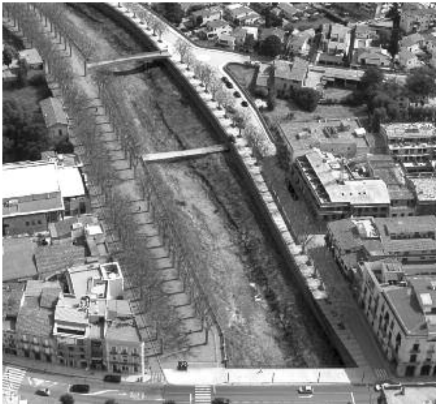
Imatge virtual de la zona que es reordena

Quant a la proposta del PSC de destinar aquests diners a la millora de les urbanitzacions Puig de Sant Ramon i el Bosquetet, l'alcalde va manifestar que