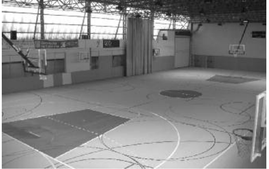
El nou terra del Pavelló d'Esports.

Així doncs, des del Patronat d'Esports podem avaluar el principi de curs com un bon començament de temporada.