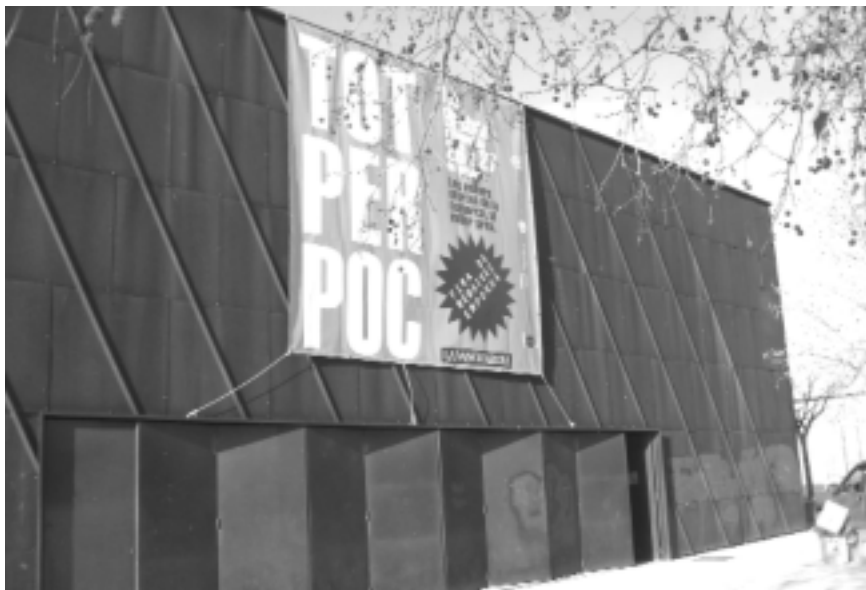
Firarebaixa Empordà es farà al pavelló firal sota l'eslògan 'Tot per poc'.

Firarebaixa Empordà torna amb vocació comarcal el 24 i 25 de gener