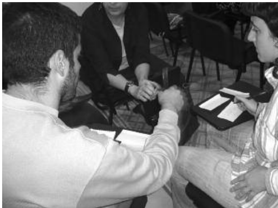
Una de les accions de participació ciutadana.

Aquesta fotografia haurà de servir, a partir d'ara, com a fonament per definir cap on volem anar en termes de promoció de la participació ciutadana. Per fer-ho, es preveu iniciar en breu la segona fase del procés que servirà per definir, a través de la celebració de diferents tallers participatius, un seguit de línies estratègiques, criteris i propostes d'actuació que serviran per planificar i