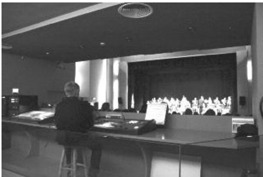
L'acte de lliurament dels premis Conrad Saló, al Teatre Mundial, el novembre passat.

Presentem la programació de teatre i de música per al primer semestre de l'any 2009.