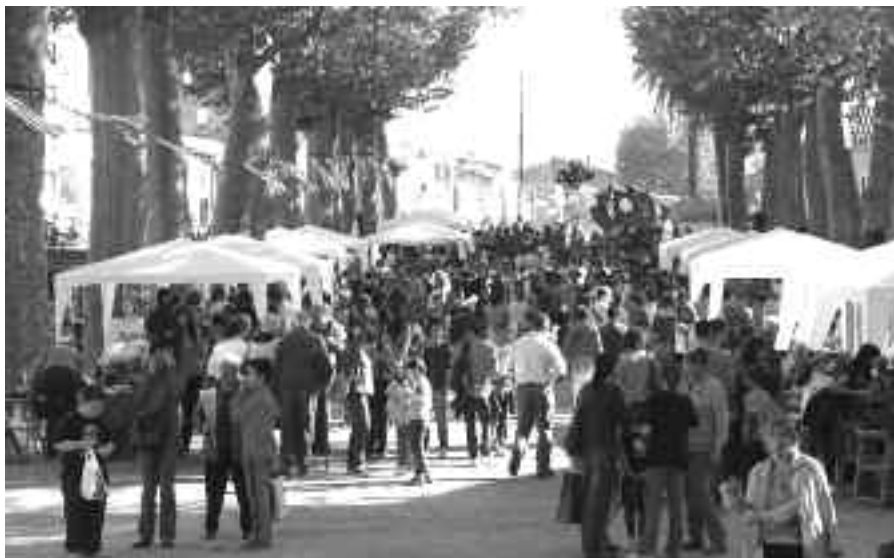
Aspecte del passeig Marimon Asprer la diada de Sant Jordi.

A les Escoles Velles, Joventut va organitzar