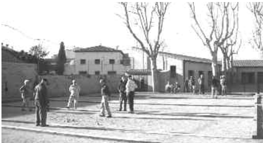
Les noves pistes de petanca s'han fet en un espai del camp de futbol vell.

L'any 2000 es va començar la Lliga de l'amistat amb els municipis de Celrà, Corçà, Torroella de Montgrí, Jafre. Al cap de dos anys s'hi van afegir Porqueres i Anglès. Aquest any es juga la X Lliga i hi participen Avinyonet, Porqueres, Corçà, Celrà, Riudellots, Santa Cristina, Torroella, Jafre, la Bisbal i Quart.