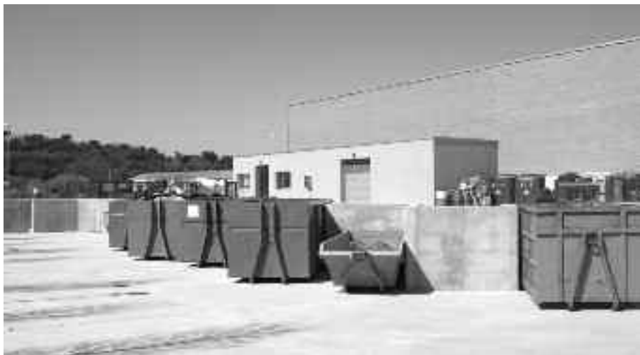
Les instal·lacions de la nova deixalleria, situada al camí vell de Corçà.

reutilitzar residus domèstics, especials o voluminosos. "Convido tots els bisbalencs a utilitzar la deixalleria", ha dit Àngel Planas. Per a les persones particulars, comerços,