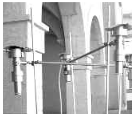
Els mesuradors de partícules, a l'Ajuntament.

La Bisbal participa en un estudi europeu per avaluar l'exposició a la contaminació atmosfèrica en col·laboració amb el centre de recerca en epidemiologia ambiental de Barcelona (CREAL-IMIM).