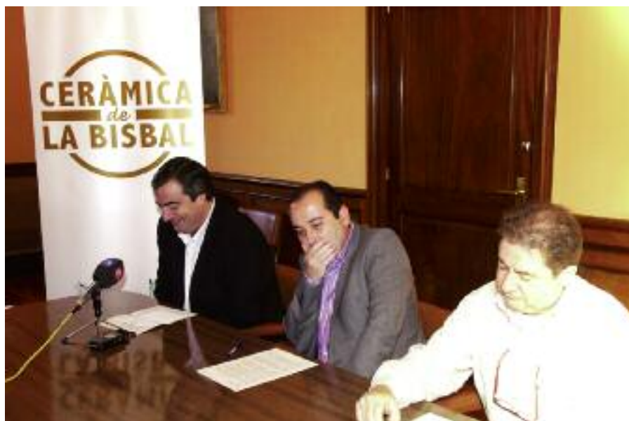
Creació, promoció i difusió de la marca de garantia Ceràmica de la Bisbal. Anys 2009 - 2010 - 2011.