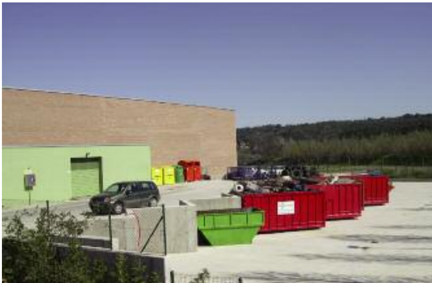
Entrada en funcionament de la nova Deixalleria Municipal.

Col·laboració amb les entitats ciutadanes per adequar festes i celebracions a la normativa vigent.