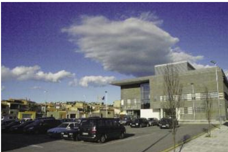
Urbanització de l'entorn dels nous Jutjats i l'Arxiu Històric Comarcal.

Pla de xoc per a la neteja de carrers: calendari setmanal i públic d'actuacions (2008-2009).