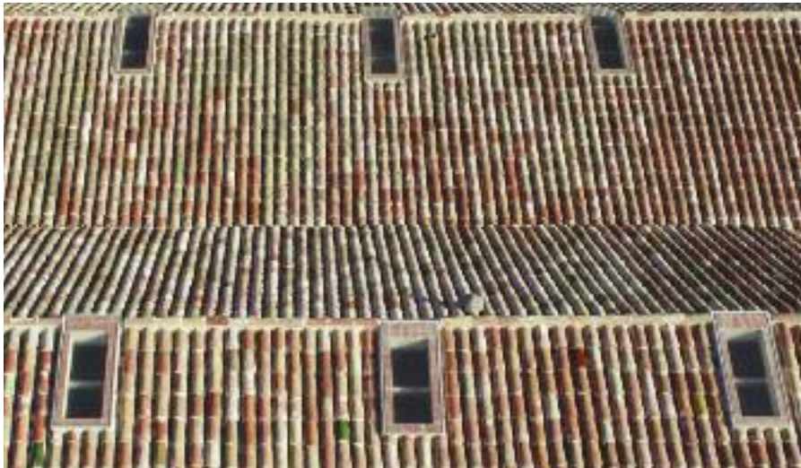
Execució de la 1a i 2a fase de les obres de rehabilitació de Terracotta Museu.

S'inicia la legislatura i es comencen a visualitzar canvis estratègics, com l' inici de la rehabilitació del Terracotta Museu, la posada en marxa com a equipament cultural del Mundial, la creació d'àrees com Educació, Promoció de la Ciutat i Desenvolupament Local, Comunicació i Participació Ciutadana, la creació de l'Aula de Música i l'inici de les actuacions de microubanisme i millora de la via pública.