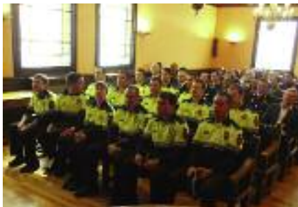
Instauració de la Diada de la Policia Local.

Programa de control i prevenció durant totes les festes nocturnes al Pavelló Firal (2009-2010-2011).