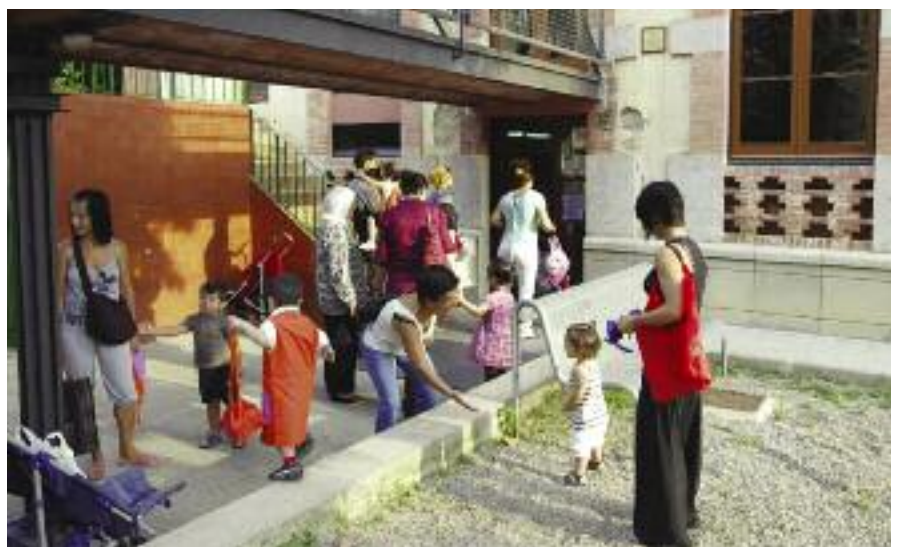
Creació d'una nova escola pública, l'Escola Empordanet (2010).

Canvi de model gestió de l'escola esportiva municipal.