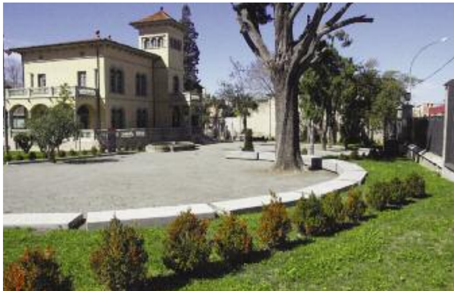
Ordenació dels jardins de Torre Maria.

El 2008 s'inicien accions de microuurbanisme que tindran continuïtat, s'ordenen els jardins de Torre Maria, es rehabiliten les xemeneies del Terracotta Museu, s'adeqüen els parcs infantils, es millora la il·luminació de Nadal, s'organitza la Fira Mercat al Carrer i la Mostra de Ceràmica a Torre Maria i s'impulsa el Castell Palau com a punt turístic i es fan millores al Pavelló d'Esports Municipal, entre d'altres.