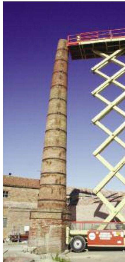
Rehabilitació de les xemeneies de Terracotta Museu.

Creació de passos elevats i eliminació de bandes reductores de velocitat: av. President Irla, Jaume II, Mas Clarà i Coll i Vehí.