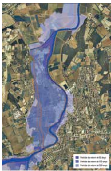
Línia tècnica d'ordenació del sistema hídric amb la proposta genèrica del canal sobreixidor.

D'altra banda, el trencament del Daró pel seu marge esquerre al nivell de la Piscina Municipal representa una mena de fusible que evita que l'aigua desbordi al centre de la ciutat. Amb l'objectiu de minimitzar el risc d'inundació de totes les zones urbanes que queden en el marge esquerre, el POUM de la Bisbal recull una proposta de l'Agència Catalana de l'Aigua de poder construir en el futur un canal sobreixidor de 2,9 km i d'una amplada variable de 30 a 60 metres que connecti el punt de trencament, a tocar la Piscina Municipal, amb la llera del Daró a nivell de l'estació depuradora (aquest traçat es correspondria amb un antic braç del Daró). Així es reduirien els episodis de desbordaments del Daró en el nucli urbà de la Bisbal (eliminació del risc d'inundació per avingudes de 100 anys de període de retorn). Val a dir que aquest canal vessador seria de caràcter tou, sense estructures de formigó i amb un fons vegetat.