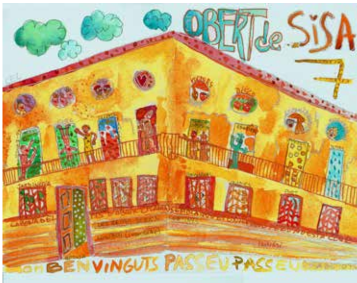
Per Ignasi Riembau

Amb l'opció de pagar des del mòbil, l'usuari guanyarà en comoditat i es resoldran problemes com quan no es porten prou monedes a sobre per poder pagar el parquímetre o l'estacionament s'allarga més del previst i a l'usuari se li acaba el temps del tiquet. L'app Aparcare també serveix per pagar l'estacionament a Calonge, l'Escala Lloret, Olot, Palamós i Pals.