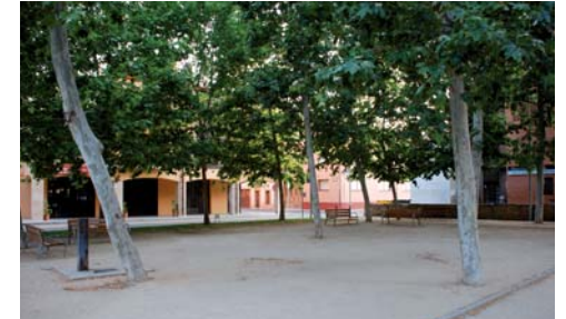
Plaça Dra. Trinitat Sais Plaja

El Grup de Dones de La Bisbal , l'any 2007, després de constatar que als carrers de la vila els noms de dones eren gairebé inexistent (amb les excepcions dels noms d'Adela Trayter i Trinitat Aldrich) va plantejar a l'Àrea de Cultura de l'Ajuntament una llista de noms per tal de corregir aquesta situació.